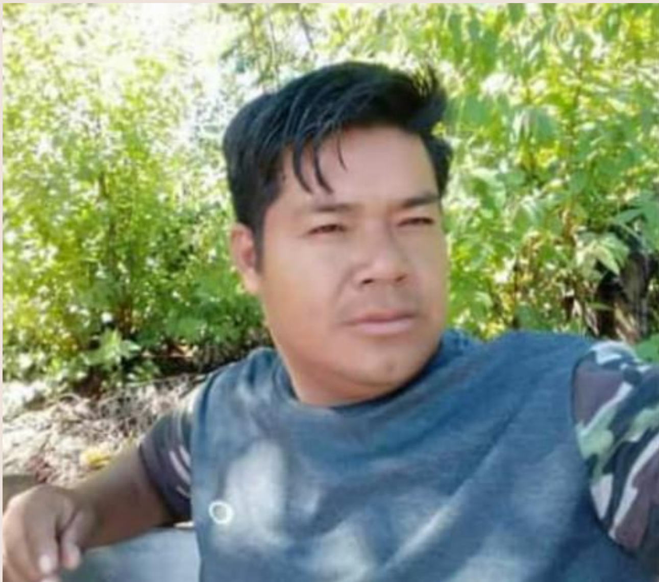
Foto: Márcio Moreira, liderança na luta pela recuperação do Território de Guapoy

Fonte: CIMI (Registros do povo Kaiowá-Guarani)