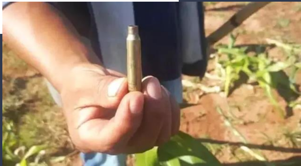
Foto (a direita): Cápsula encontrada em área de confronto entre indígenas e policiais.